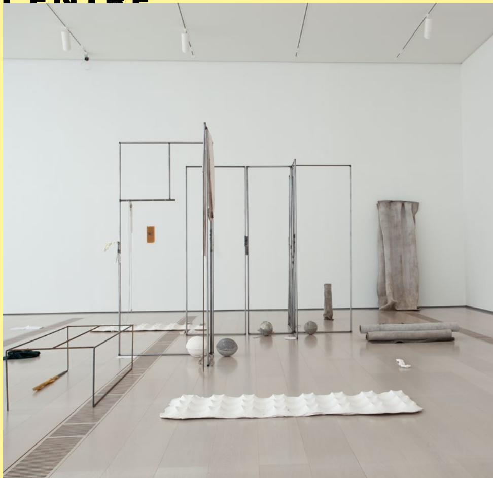
NORA AURREKOETXEA | jausi erori amildu