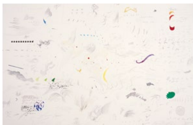
Sin título, 2005. Colección particular