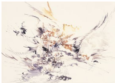
Sin título, 2005. Colección particular

Fijaros bien en esta forma de pintar de la artista porque la volveremos a ver más adelante. Usará estas formas para contarnos cómo ella siente las cosas que nos pasan.