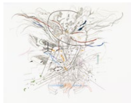
Sin título, 2000. Colección particular

En este dibujo hecho con tinta y lápices de colores nos cuenta cómo ve ella la ciudad de Nueva York donde se mezclan las calles, las ideas de ciudad para el futuro de Rem Koolhaas (arquitecto) y el movimiento de los aviones que llegan y se van de ella constantemente.